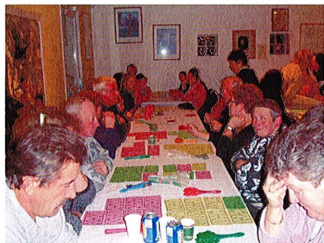
14 novembre 2009 : LOTO du Comité des fêtes