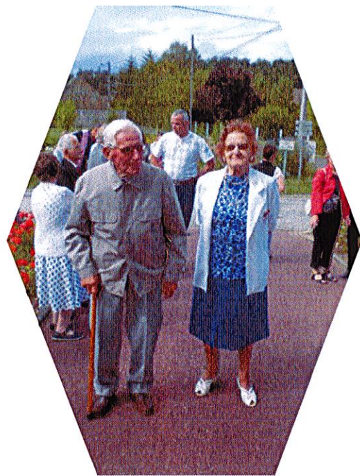
29 juillet 1939 - 1 er août 2009 : 70 ans de mariage et... 185 ans à eux deux ! Les « jeunes époux » arrivent radieux à la Mairie