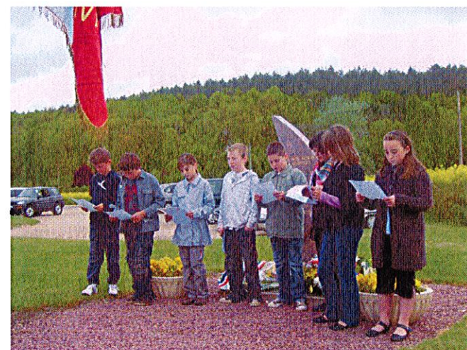
8 mai 2009 : Les jeunes chantent la Marseillaise au cours de la Cérémonie au monument.