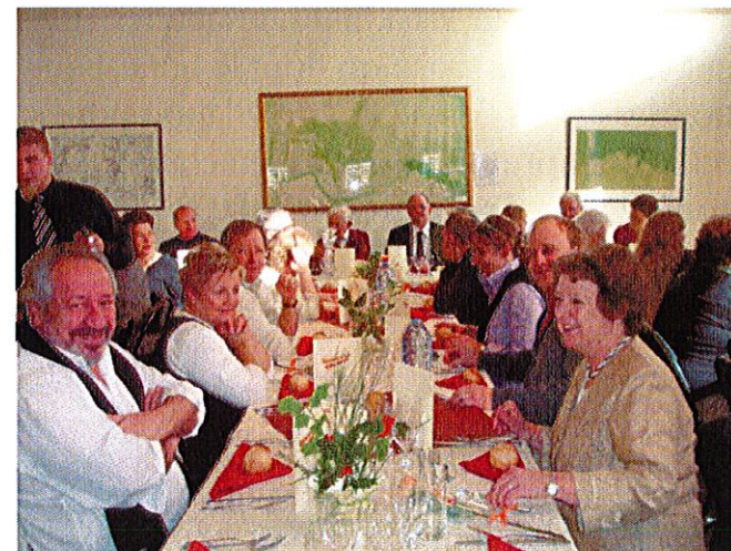
Dimanche 29 novembre : 42 convives réunis autour d'une « bonne table » au repas des Aînés