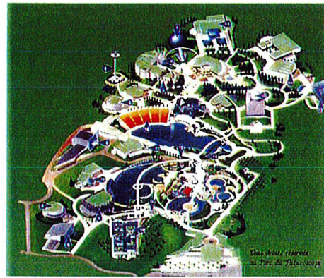
Plan du Futuroscope