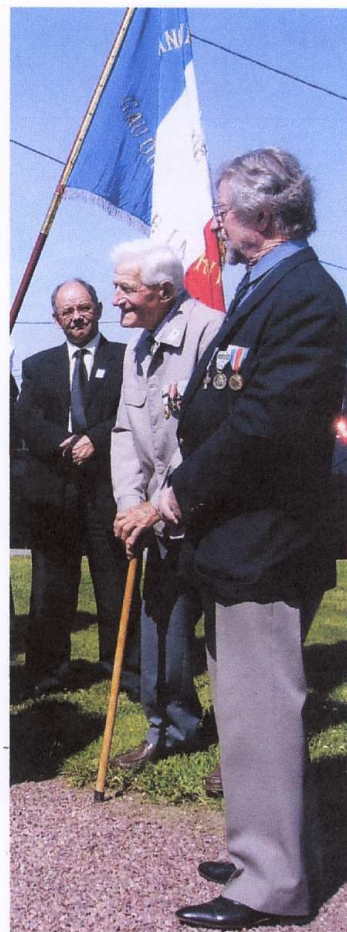
Souvenir de la cérémonie du 8 mai

Dans chaque Commune, la cérémonie Commémorative sera suivie d'un « pot de l'amitié », à la Mairie, où Maire et Conseillers Municipaux seront heureux de vous accueillir.